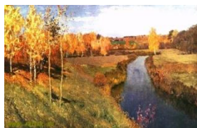
1. «Золотая осень»