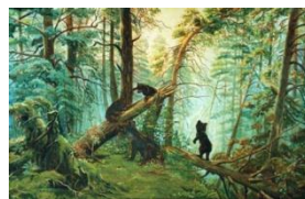
3. «Утро в сосновом бору»