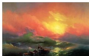
2. «Девятый вал»