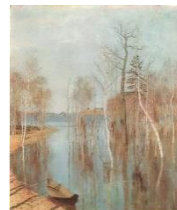
4. «Весна. Большая вода»